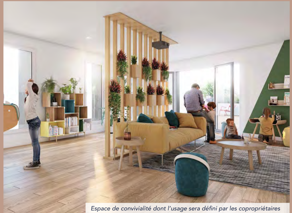
Espace de convivialité dont l'usage sera défini par les copropriétaires